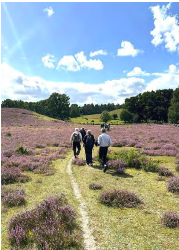
Vandring i Olles fotspår över de ljungklädda kullarna i Drakamöllans naturreservat.