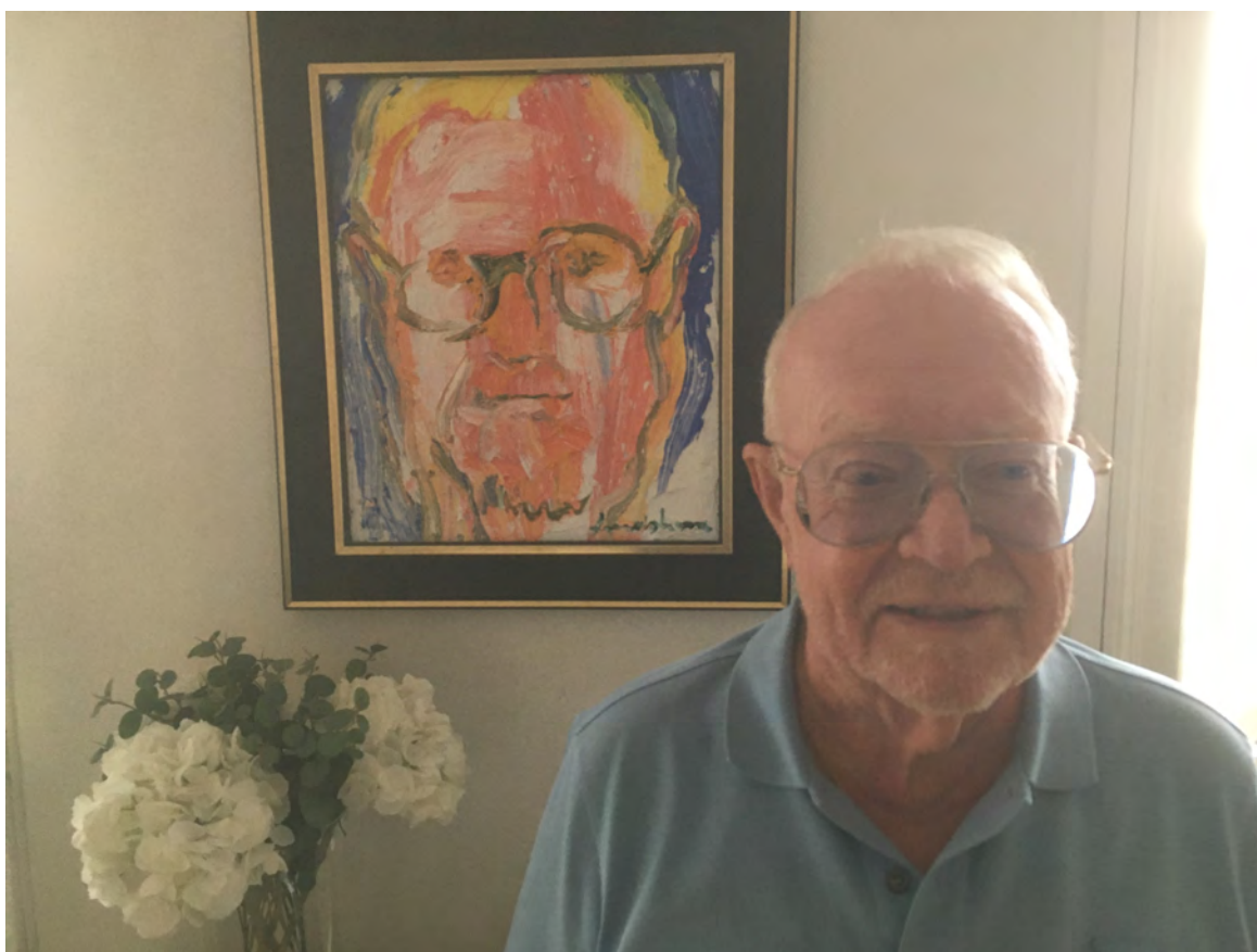
... och här framför ett porträtt av honom själv, målat av konstnären Bengt Lindström.

- Jag är kanske lite ortodox, men jag tycker att det alltid måste finnas rottrådar kvar till visornas ursprung. Den känslighet som Olle hade i allt han gjorde måste komma fram.