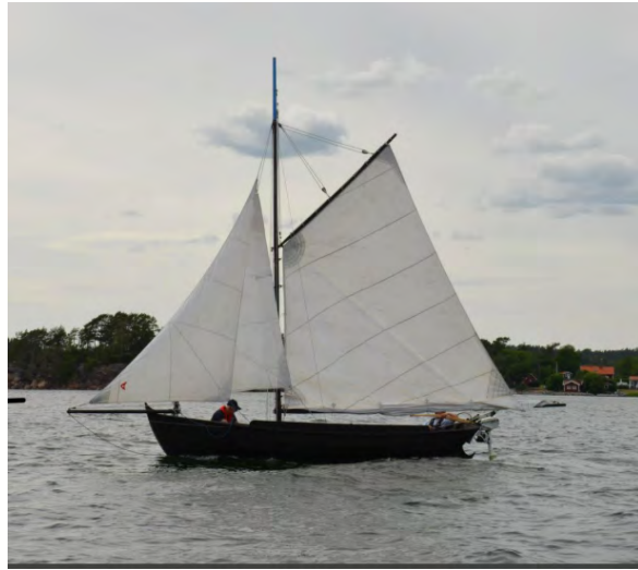
Olles roslagseka "Fridens lilja" är till salu.

"Fridens lilja" är en roslagseka som byggdes i början av 1980-talet efter en medeltida förlaga. Olle ägde båten fram till slutet av 80-talet, då den såldes vidare. Ekan är ca 7 m lång och 2,5 m bred och till den hör fyra segel, gaffelstor, fock, klyvare och toppsegel. Båten är i bra skick och ligger för närvarande i Laggarsvik på Ljusterö i Stockholms skärgård. Pris: 25 000 kr.