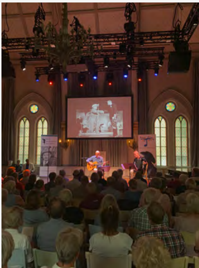
Fullsatt till sista plats under konserten "Evert och Olle – visans mästare".