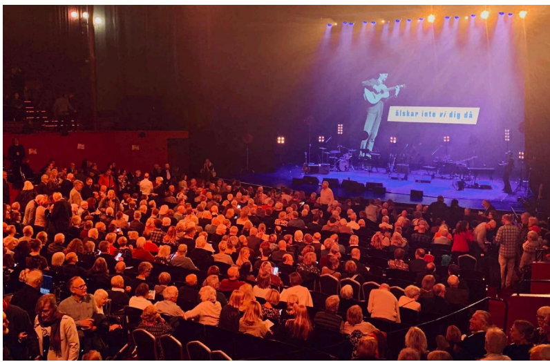
Ett fullsatt Cirkus.