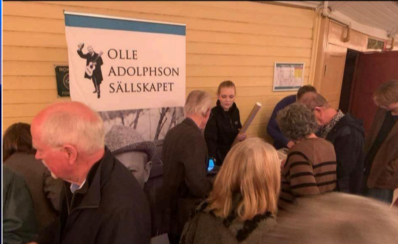
Olle Adolphson-sällskapet var på plats.