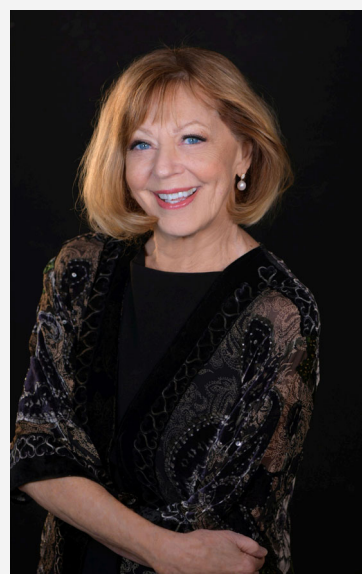
Lill Lindfors.